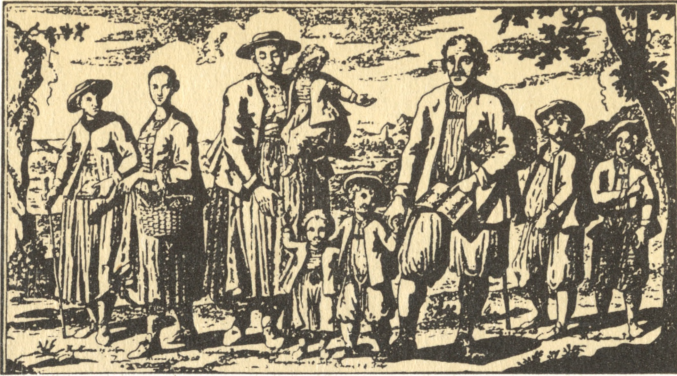
Kolonistai Zalcburgo vokiečiai, atvykę į lietuvininko sodybą įsikurti