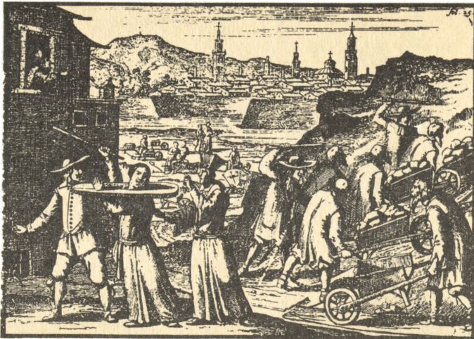
Šitaip vokiečių feodalai baudė Mažosios Lietuvos baudžiauninkus lietuvius