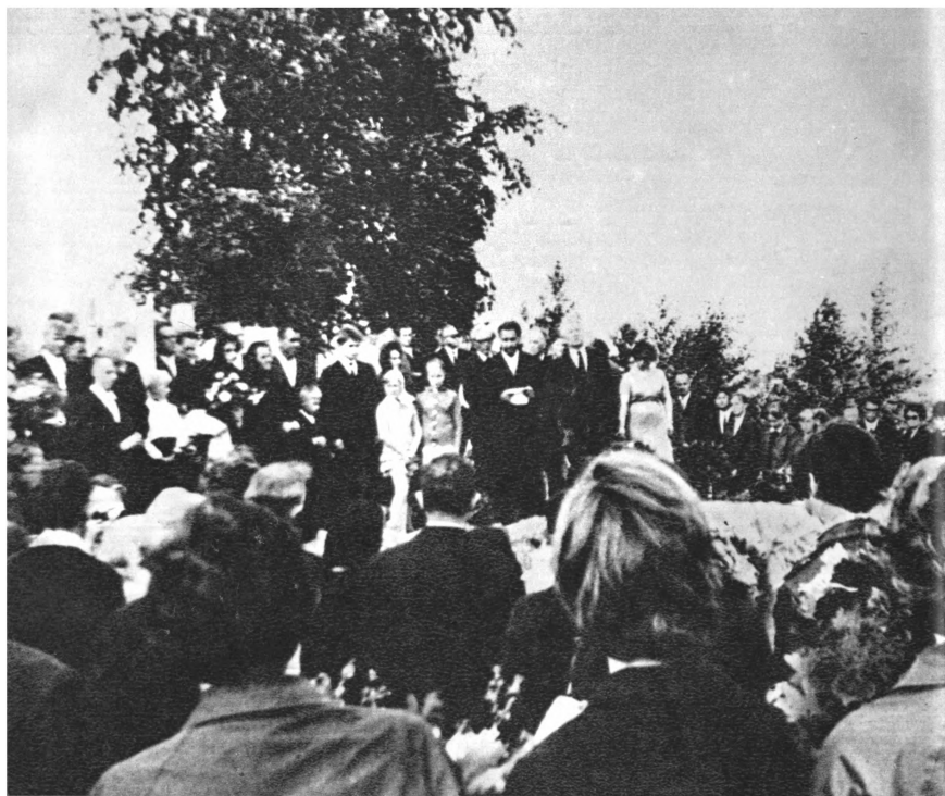
Atsisveikinimas su velioniu Devyduonių kaimo kapinaitėse