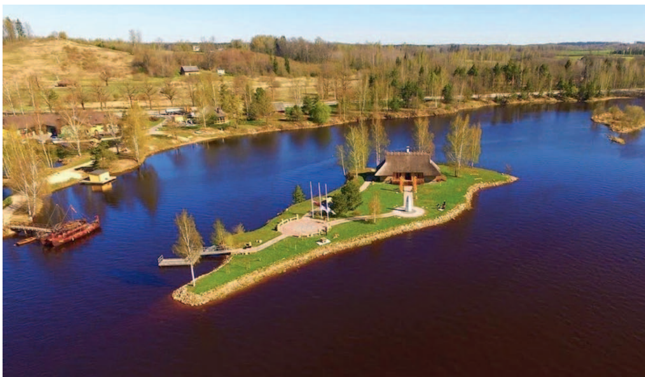
Dievturių Luokstenės šventykla ( Lokstenes svētīnca).