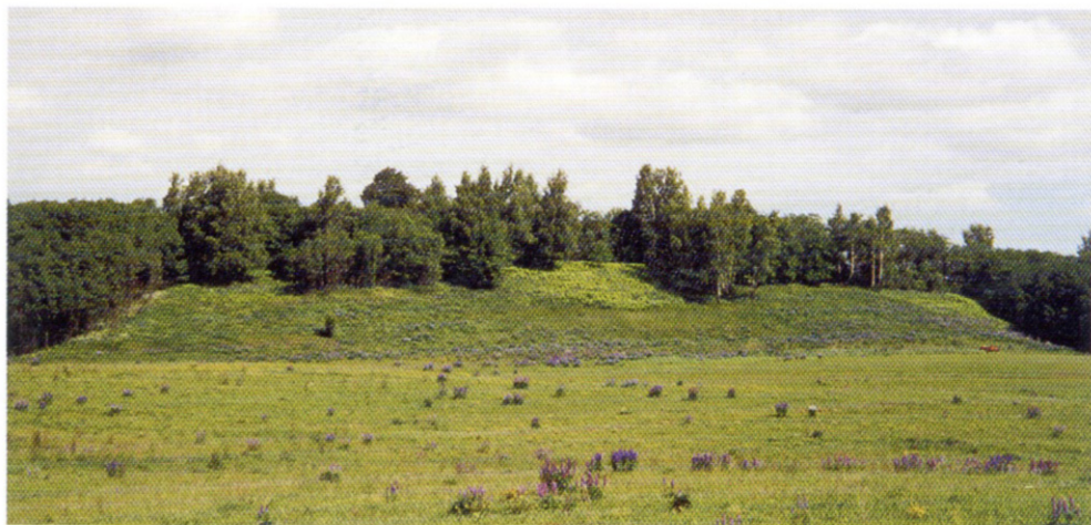
Gaukeliškių piliakalnis. The Gaukeliškės Hillfort.