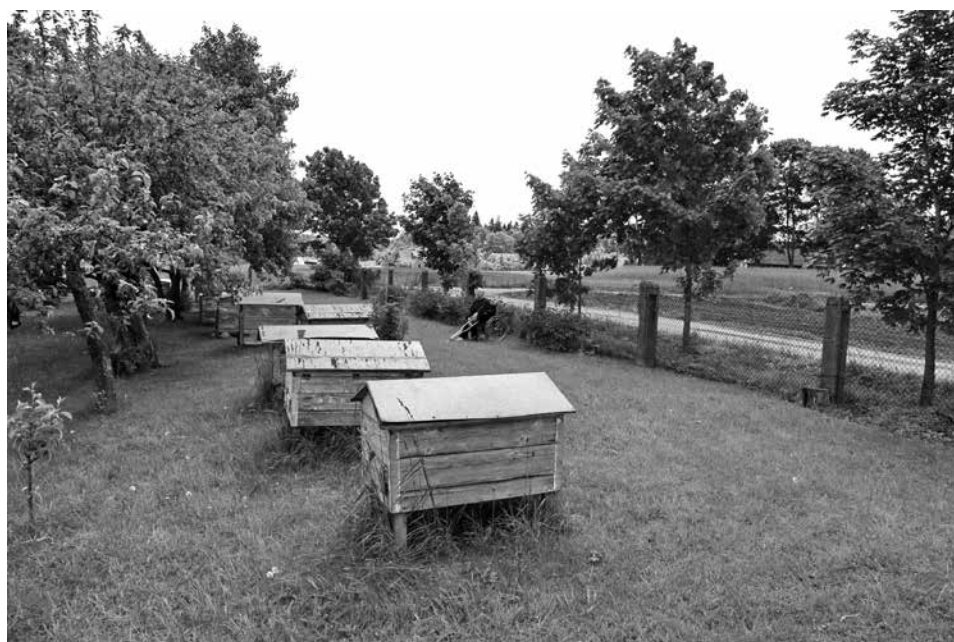
5. Janina šeimos bityno priešakyje. 2012 m. birželio 6 d.