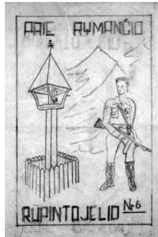
LLKS leidinio „Prie rymančio Rūpintojėlio“ viršelis ir nugarėlė. 1949–1950 m.

Baigiant pasakojimą apie tai, kokie talpūs, įvairūs ir reikšmingi rašytiniai laisvės kovotojų dokumentai, belieka sau ir skaitytojams linkėti išminties, valios ir jėgų (at)kuriant Lietuvos partizanų archyvą. Šiuolaikinė įranga ir metodai dokumentus skaitmeninti, saugoti ir naudoti virtualioje aplinkoje teikia tokiam darbui puikias, iki šiol nė maža dalimi neišnaudotas galimybes. Svarbiausia, kad vienoje atviroje vietoje sutelkti, deramai aprašyti dokumentai prabilis pačių kovotojų balsais ir atskleis daugelį iki šiol nežinomų paslapčių – leis įminti slaptuosius vardus, dalinių ir vietovių pavadinimus, papasakos apie karo eigą ir tūkstančius pamirštų mažų didelių partizanų pergalių.