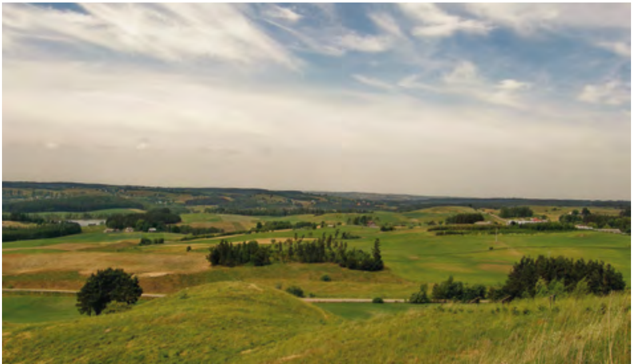
8 pav. Reginys nuo Gulbiniškių kalno (Suvalkų vaivadija, Lenkija). 2008 m.

išlaisvins kraštą nuo okupantų priespaudos. Toji kariuomenė yra užkeikta Vilniuje, Gedimino kalno pilyje ir kituose Lietuvos senovės piliakalniuose. Vėlykų dieną ta kariuomenė pabus ir ruošis žygiui prieš priešą, kurį ir išvys iš mūsų krašto. (LTR 2566/9; cit. pagal: LPTK)