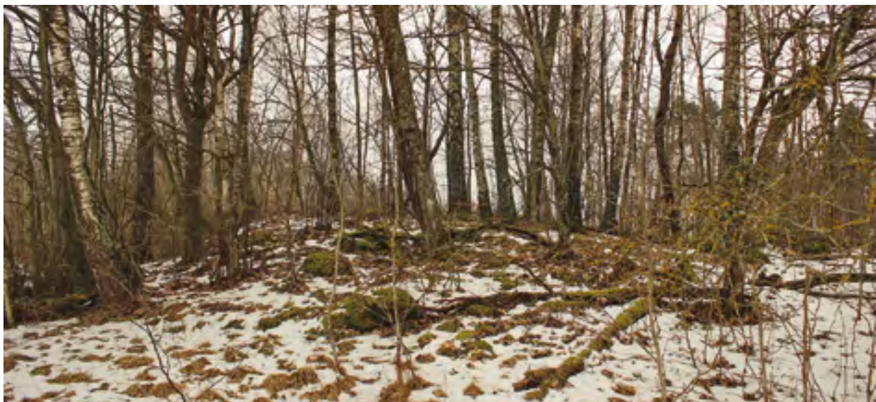
3 pav. Pilkapis istorinio Sandrausiškės dvaro laukuose, žvelgiant iš vakarų.