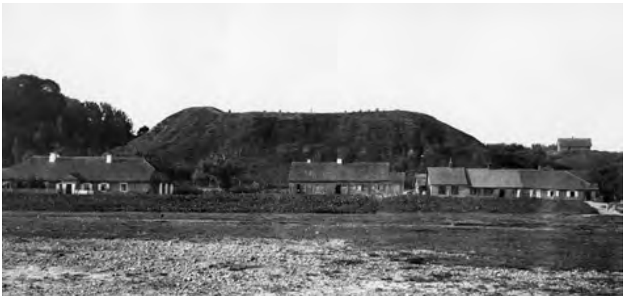
4 pav. Gedimino kapu vadinamas piliakalnis Veliuonoje (kairėje pusėje kapas – gynybinis piliakalnio pylimas), žvelgiant iš pietų. XX a. pradžia. (LPA 2005: 237)

Šaunūs vyrai sėdi ant žirgų, geležiniais šarvais ginkluoti nuo galvos ligi kojų. Jie sėdi nejudėdami ir miega, o jų žirgai stovi galvas nuleidę, kaip negyvi. Visur amžina tyla, kaip danguj. Nežinomasai, ūkininką požemin atvedusis karys, paėmęs trimitą, triskart sutrimitavo. Tik suskambėjo trimito balsas, tuojau nubudo miegančioji kariuomenė <...>. Vadas paklausė ūkininko: „O kam mumis šaukiate, ar jau šiandien Švento Jono diena?“ Ūkininkas sako: „Dar ne šiandien.“ „Švento Jono dieną, kai išgirsime šaukimą, mes kelsimės ir josime krašto vaduoti“, – tai pasakęs karys sėdo ant žirgo ir, davęs ženklą savo kariuomenei nurinti, vėl kartu su jais užmigo amžinu miegu. (Buračas 2011: 408, 410; plg. „Seniau šnekėdau, ka Gediminu kariuomenė kalne miega. Kai ateis laikas, ji kils i eis kariaut, i visus nukariaus.“ – P. Ona Eimutienė, 53 m. iš Pakalniškių k.,