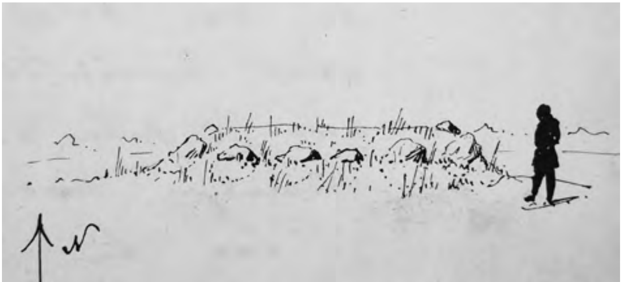
1 pav. Pilkapis istorinio Sandrausiškės dvaro laukuose (Šiluvos seniūn., Raseinių r.).

T. Daugirdo piešinys 1887 m. rugpjūčio 22 d. žvalgomosios archeologinės išvykos aprašyme (Dowgird 1889: 284).