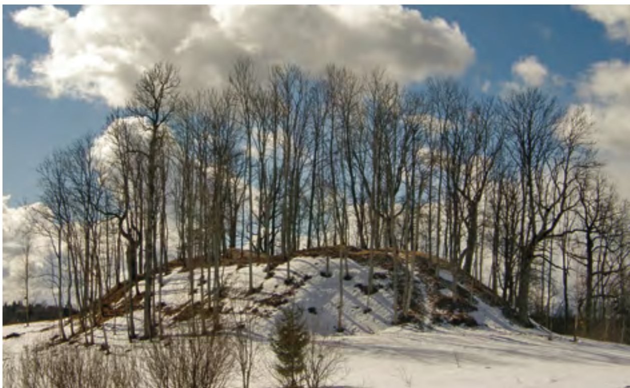
5 pav. Džiugo kapu vadinamas piliakalnis Telšių prieigose, žvelgiant iš šiaurės rytų. 2011 m.

Veliuonos seniūn. U. R. Tamošiūnaitė–Merkienė 1958 m. – Kriščiūnas 2001: 1082).