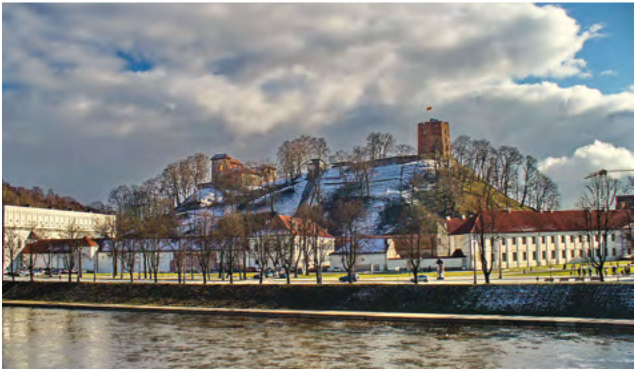
10 pav. Gedimino pilies kalnas, žvelgiant iš vakarų.