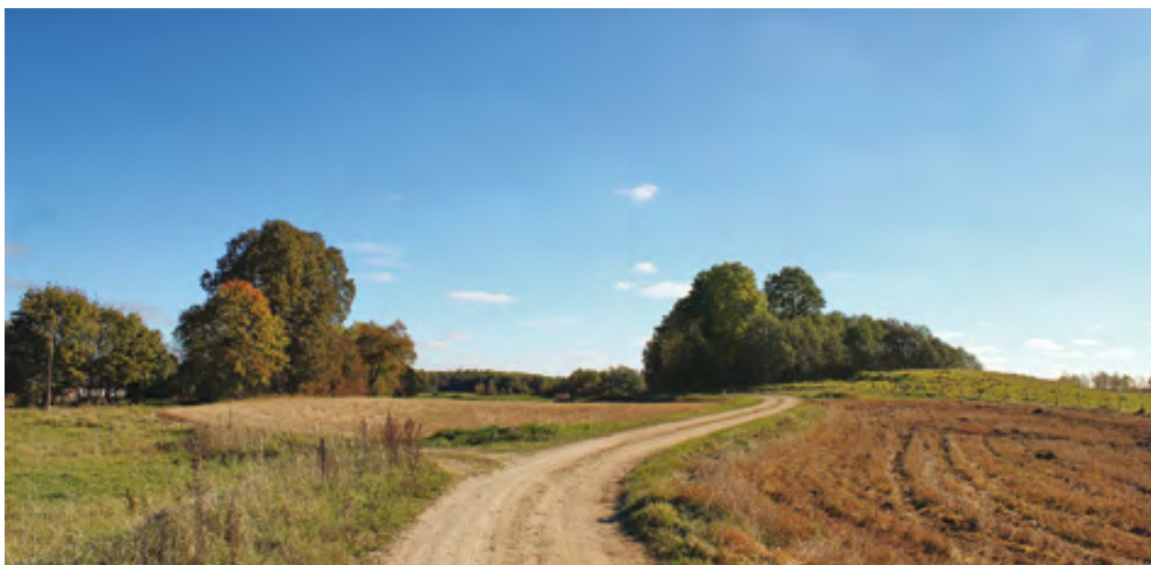
7 pav. Trumpainiai, Laukuvos seniūn., Šilalės r.: senoji Milašių sodyba (kairėje) ir senkapiai, kartais dar vadinami Šventąja žeme (dešinėje), žvelgiant iš vakarų. 2015 m. V. Vaitkevičiaus nuotrauka.

Vokiečių okupacijos metais Velykos buvo Šv. Morkaus dieną. Žmonės laikė tai labai nepaprastu dalyku, žadančiu įvairių stebuklų. Visoje Švenčionių apyl[inkėje] kalbėjo žmonės, kad tais metais atsiras stebuklinga kariuomenė, kuri