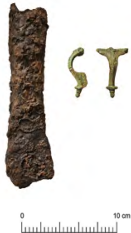
2 pav. Archeologiniai radiniai – įmovinis kirvis ir žalvarinė lankinė segė iš Tautušių pilkapių vietos (Pagojūkių seniūn., Raseinių r.), perduoti į Lietuvos nacionalinį muziejų.