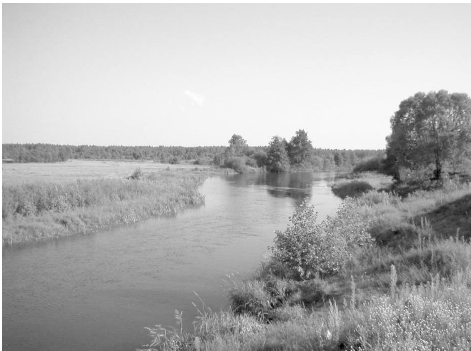
1 pav. „Pelkėtoji“ Neris ties Kameno k. Vileikos r. 2003 m.

Iki šiol gyvojoje kalboje vartojami du vienos upės vardai Vilija ir Neris nuo seno yra mokslinių diskusijų