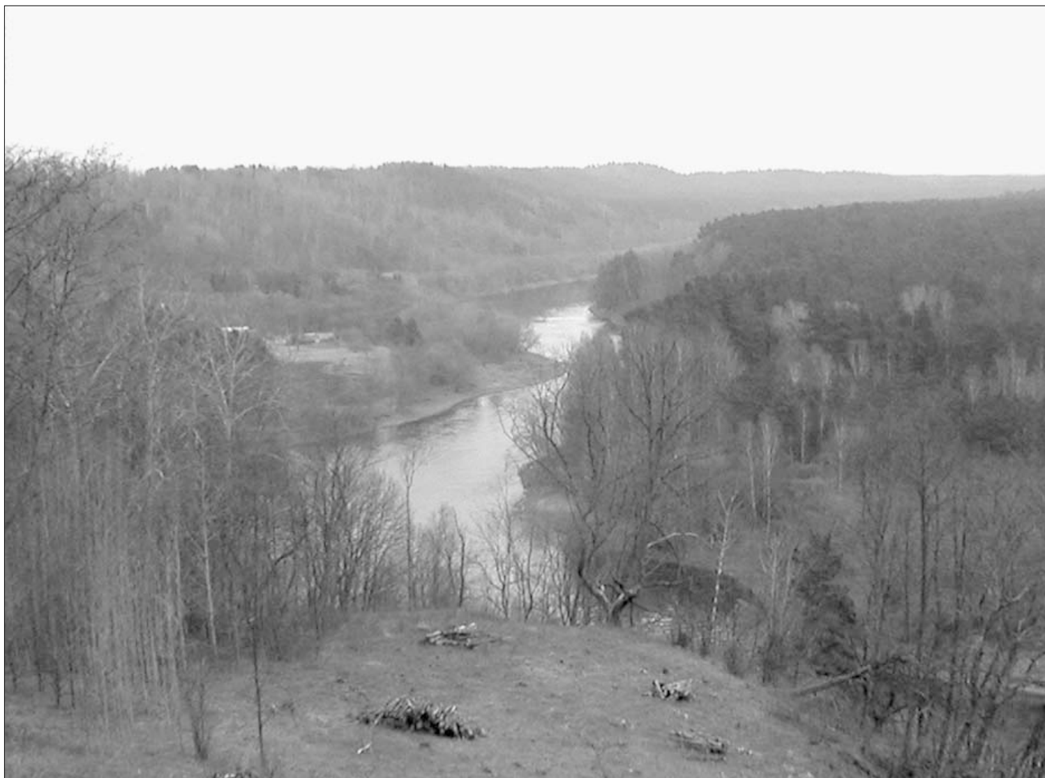
2 pav. „Akmeningoji“ Neris ties Karmazinų k. Vilniaus r. 2005 m.

Vilijos-Neries baseino pasidalijimas į dvi (rytinę ir vakarinę) dalis akcentuojamas ne be reikalo. Remiantis pa-