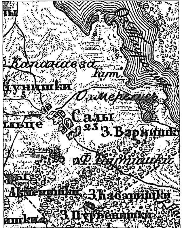
1 pav. Sėlės kaimas (Салы) XIX a. pabaigos topografiniame žemėlapyje.