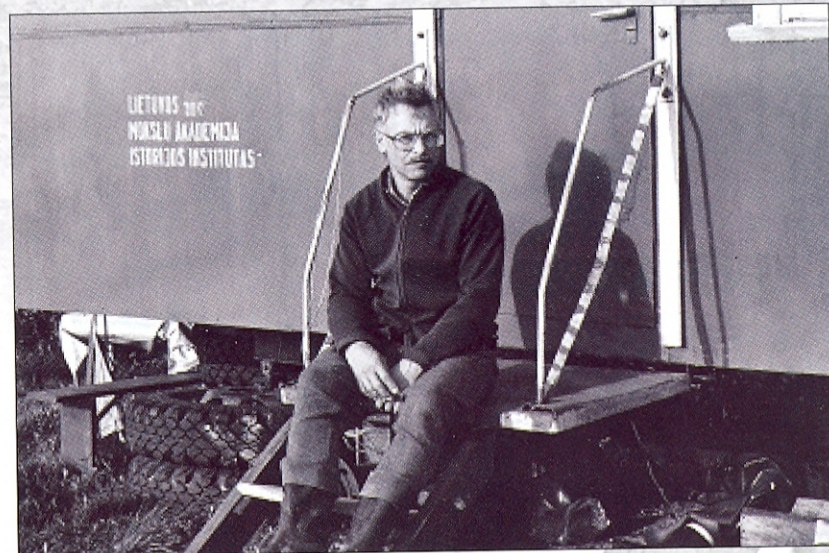
1991 m. kasinėjant Kalniškių kapinyną (Raseinių rajonas) During excavations of Kalniškiai cemetery in Raseiniai district 1991