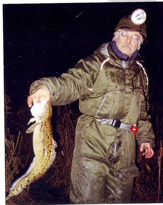
Naktinė žvejyba / Night fishing