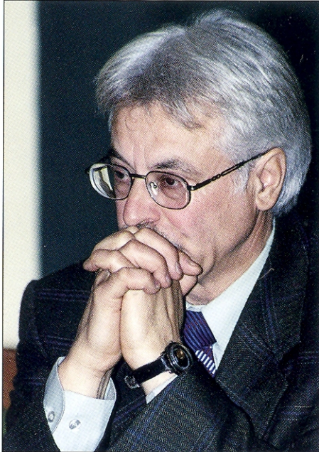
Vytautas Kazakevičius (1951–2005)