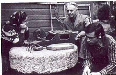
Etnografinėje ekspedicijoje 1976 metais During ethnological field-work in 1976