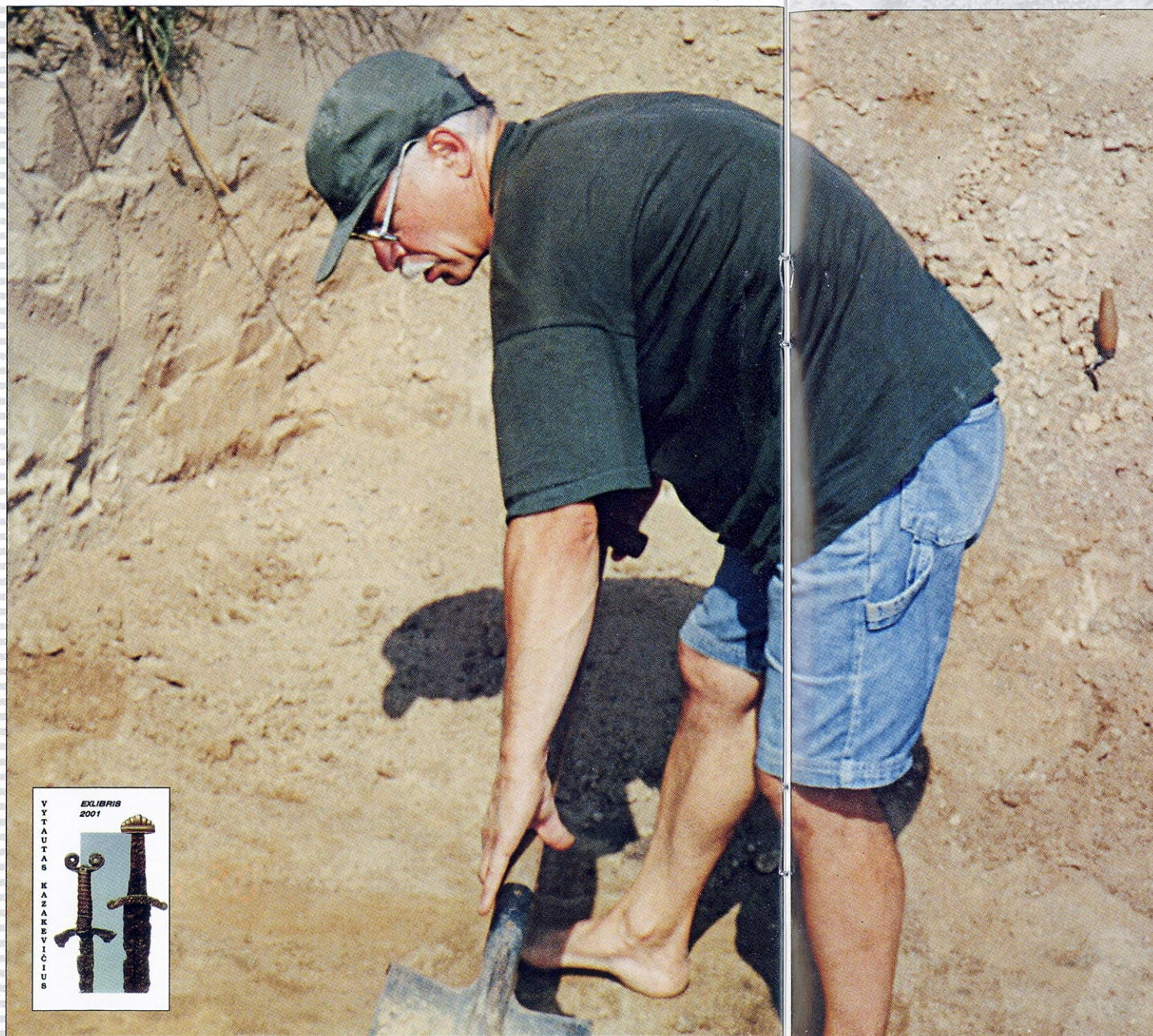
Kalniskų kapinių tyrinėjimai 2002 metais / Investigations of Kalniskiai cemetery 2002