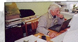
2004 m. darbo kambaryje Lietuvos istorijos institute in the workroom at the Lithuanian Institute of History 2004