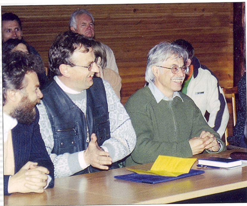
2000 m. tarp kolegų konferencijos Palūšėje metu / Among the colleagues in the conference at Palūšė 2000