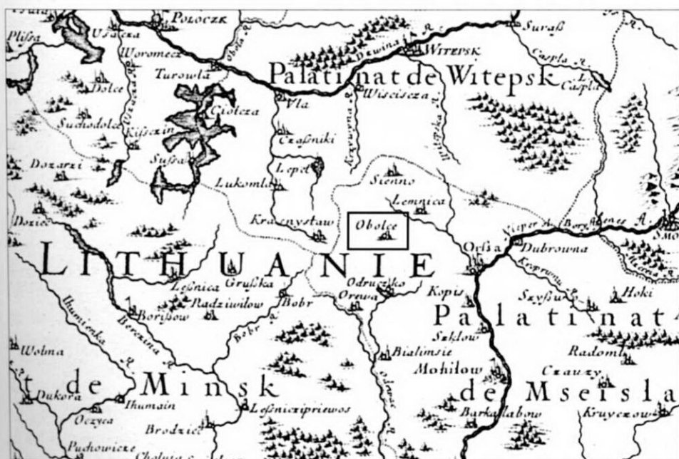
4. Фрагмент карты Великого Княжества Литовского 1645 г. [LŽ 70–71].