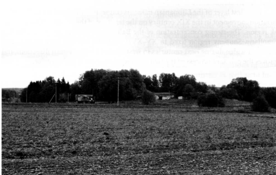
2. Вид на место двора и костела Обольцев со стороны городища. Снимок В. Вайткявичюса 2006 г.