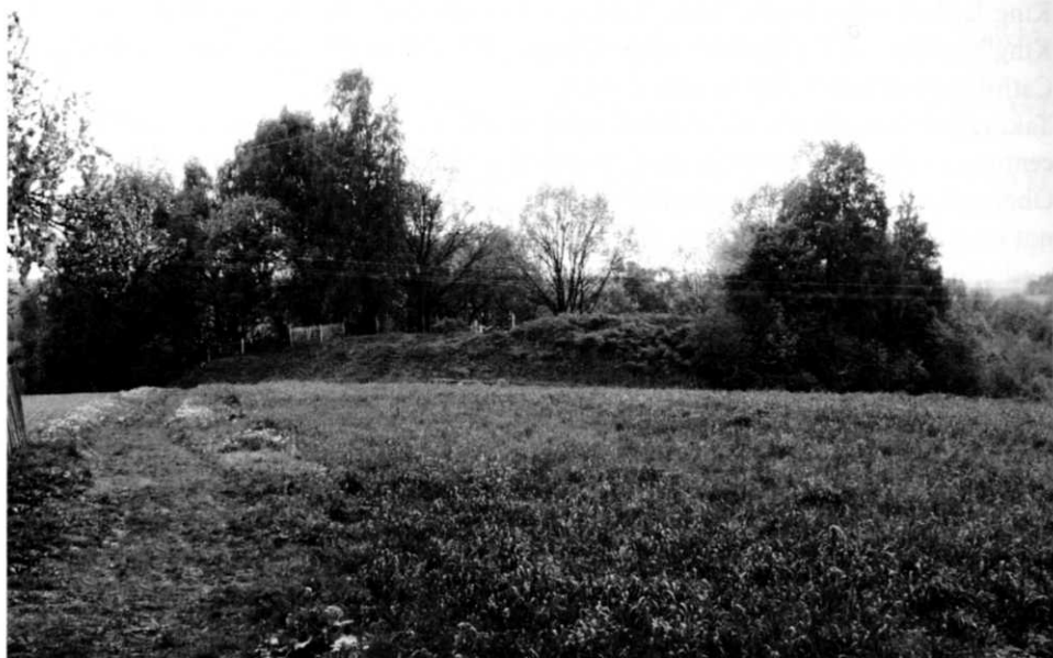
1. Городище в дер. Клебань. Снимок М. Ужпелькиса 2006 г.