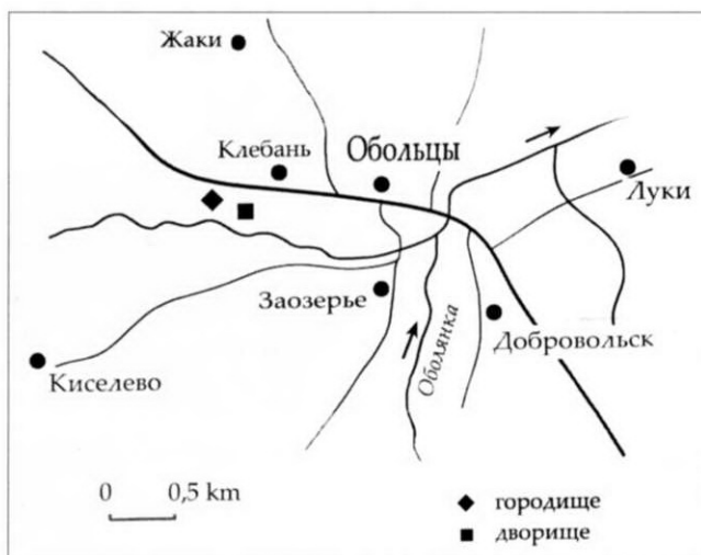
3. Схема археологических памятников у н.п. Оболцы. Составил В. Вайткавичюс, 2007.