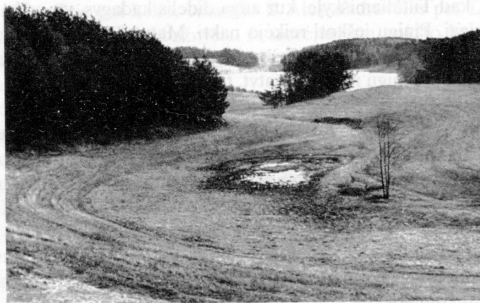
3 pav. Bradėsų Tiltaliamiškis. 1976 m.

rės ribojama aukštumų, iš rytų - piliakalnio (3 pav.). D. Medikas Tiltaliamiškio vietoje 1993 m. įrengė tvenkinį.