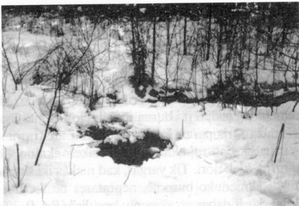
5 pav. Mažeikių Šaltupėlis. 1994 m.

Šaligojaus (Šalygos) šaltinis trykšta Obelių g-jos kv. Nr. 37 (vadinamo Gojaus mišku) pietrytinėje dalyje, apie 350 m į pietvakarius nuo A. Gavelio sodybos, maždaug 350 m į rytus nuo Kriaunos upės, prie Gojaus miško proskynos (senkelio Kriaunos-Obeliai). Trykšdamas šaltinis sudaro maždaug 1 m skersmens akį, kuri būna iki 0,8 m gylio. Išlikusios į šaltinį įleisto ažuolinio kubilo liekanos.