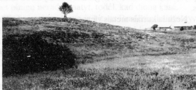
4 pav. Duñdiškių Bažnytkalnis. Apie 1960 m. Ng. Nr. 2340

randama didelių kaulų, ir sako, kad tai milžinų" (Užr. A. Pulpelytė - G. Gruzdo asm. archyvas).