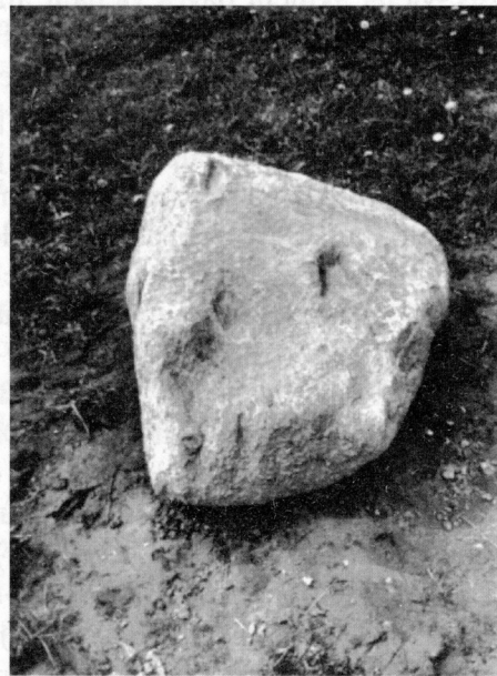
7 pav. Pākriaunio akmuo. 1972 m. A. Merkevičiaus nuotr. IILAS. Ng. Nr. 30394

„Pākriaunio kaimo gale ant Kriaunos upės pylimo yra vienas, žmonių vadinamas velnio pamestas akmuo [ originale - vienas žmonių pažymėtas akmuo] (...). Tame akmenyje yra trys pėdos: viena Dievo, kita aniuolo ir trečia velnio. Apie šitas akmenyje atsiradusias pėdas žmonės pasa-koja taip. Labai seniai ėjęs pro tą vietą, kur akmuo stovėjo, Dievas su aniuolu. Pamatęs tat velnias, pasivertęs aniuolu ir nematant Dievui priėjęs prie jų. Tada Dievas nebegalėjęs