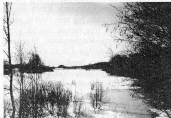
2 pav. Antānašės pievos Alkai arba Aukai. 1994 m.

2. Tarp Antānašės (Obelių seniūn.) ir Obelių, Našio ir Obelių ežerų sąsmaukoje užliejamos 20 ha ploto pievos yra vadinamos Alkais arba Aukais (2 pav.), jų viduriu prateka Kriauna ( LŽV - Antanašė, Obelių vls.; P. Juodvalkis, 1936; G. Gruzdo ir V. Vaitkevičiaus duomenys ).