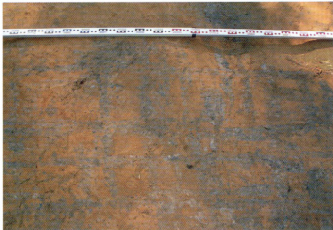
X pav. Plikiškių senovės žemdirbystės vieta. Fig. X. Ancient agricultural site in Plikiškės.