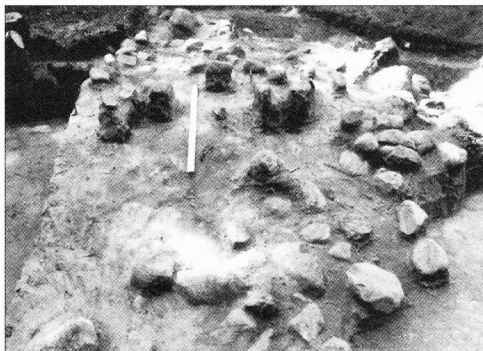
27 pav. Santakos pilkapio 6 sampilas tyrimų metu.

Fig. 26. Santaka barrow 5 in the course of investigations.