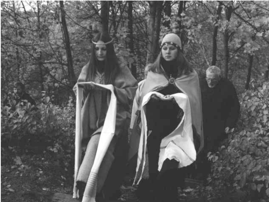
Kylant į apeigų vietą – Gedimino kapo kalną.