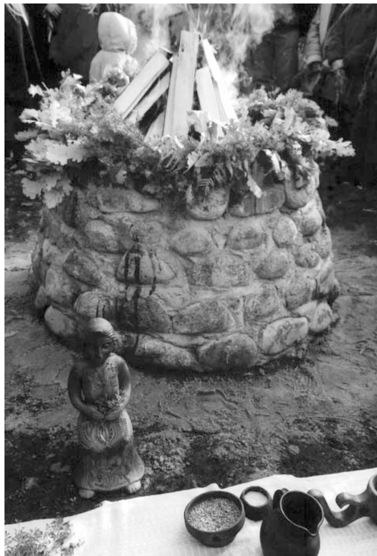
Degantis aukuras ir apeigų reikmenų fragmentas.

J. V. Nėra jokio uzurpavimo, tik atsirado vėliavnešys, kuris niekada nesakė, kad Perkūną reikia traktuoti kaip perkūnus plūstančią energiją... Atvirkščiai, sakoma: aiškinkit kaip norit, bet Perkūnas yra ir jis veikia. Palikta visiška interpretacijų laisvė. Mes sakome: vienovė įvairovėje. Ginčykis, aiškink kaip nori, bet esi mūsų bendražygis, kol esi tautinės kultūros,