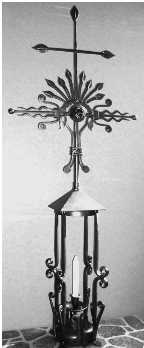
3 pav. Č. Pečetauskas. Kalviškas kryžius. XX a. pab.

įtraukti metalo kryždirbystę į naujųjų tautodailės skulptūrų-paminklų puošybą, kviesti jos kūrėjus į parodas. Kita vertus, kalvystė rutuliojosi ir tradicinėje terpėje per tėvų, draugų ir pažįstamųjų įtaką ir būsimų kalvių tiesioginį sąlytį su kraštovaizdžio paveldu bei vietiniais religiniais papročiais.