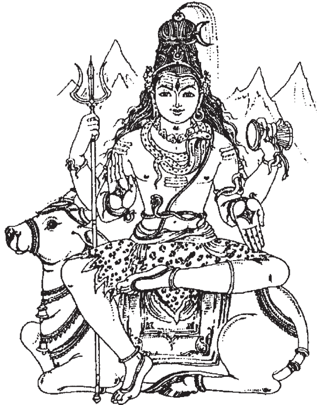
4 pav. Hinduizmo dievas Šiva, dėvintis per petį sakralų raištį jadžniapavytą // Harshananda S. Hindu Gods and Goddesses . – Madras, 1981. – P. 9.

Slibinas, gyvatė, kitų kraštų mitologijose siejami su vandenimis ir ugnimi, šviesa, yra neapvaldytos, nepažabotos gyvybinės energijos simbolis. 53 Panašiai ir lietuvių laumės sie-