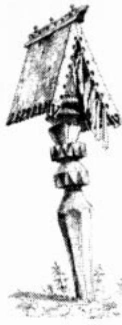
5 pav. Juostelės kaspiniai antkapiniame suomių paminkle Karelijoje // Blasted Y., Suckdorf V. Kareliške gebande. – Helsingfors, 1900. – T. 76.

„Užteka teka skaisti saulelė“ 61 tipo dainos gerai atspindi Aušrinės ryšį su Laima (ar Laume), rasa, svaigančiu gėrimu ( alus archajiškesne reikšme buvo ir midus 62 ). Atrodo, kad šio tipo dainose Aušrinė kontekstiškai siejama su Laima (arba Laume). Užtekėdama Saulė pradžioje randa žvaigždėlę (gamtoje tai Aušrinė), o vėliau burnoja ant Laimos (ar Laumės), kuri ketino sukviesti visas žvaigždes į puotą. Galima