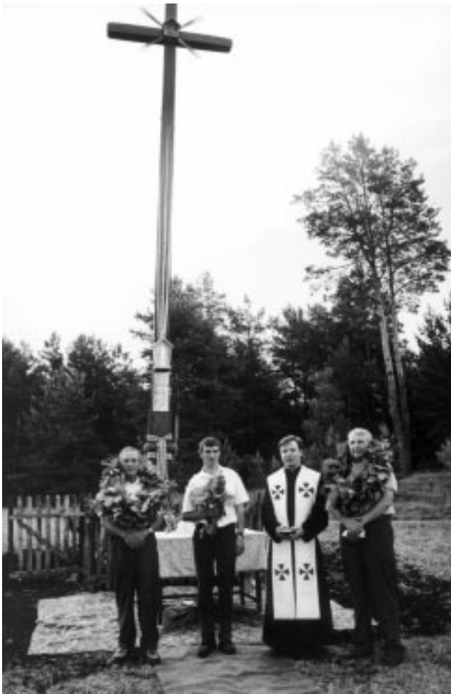
6 pav. Juosta aprištas kryžius Dzūkijoje, Mardasavo k. 1999 m.

Panašiai, kaip lietuvių mitologijoje audimo semantikos laukas apima ir bites, taip senovės arijų Ašviniai tiesiogiai siejami su bitėmis. Vedose „audimui pirmyn ir atgal” prilyginamas himnų giedojimas, jų poezija, įkvėpta Ašvinių. 71 Dvyniai Ašviniai tiesiogiai siejami su bitėmis, vadinami madhupa – ‘medaus gėrikai’. Kiekvieną rytą jie iššlaksto medų po visą kraštą, jie veža medų ratuose, duoda jį bitėms, šlaksto juo auką. 72 Kaip Ašviniai susiję su medumi ir soma -, ekstazę iššaukiančiu žynių ir dievų gėrimu (F. B. Kuiperis mano, jog somos pirmtakas buvo svaiginantis medaus gėrimas, 73 o Vedų ir šamanizmo tyrinėtojai yra atskleidę bendras sakralias somos ir kitų svaigalų ištakas ir jų rudimentinį gyvavimą eu-