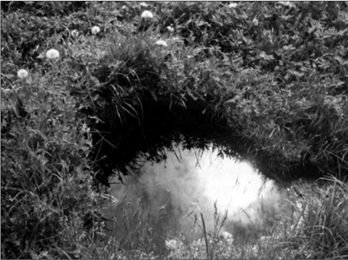
Šaltinis Mildos slėnyje. Mažeikių r. Netoli Sedos.

gausa neturėtų stebinti – lietuvių mitologija susidarė iš įvairių genčių bei skirtingų istorinių etapų paveldo.