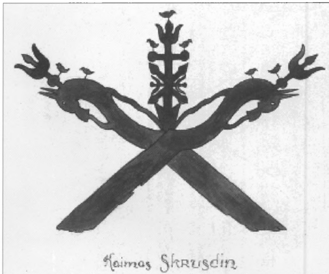
Lėkiai – arkliukai, statinio Skruzdynės kaime (Nida, Kuršių nerija) stogo puošybos detalė.

Antai vienos pasakos herojus paeiliui sugavo saulės arklį, mėnesio arklį ir žvaigždės arklį. Kitame pasakos variante pas jį atlėkė arkliuks kep saula, arkliuks kep mėnuo ir žvaigždėm apsegiots arkliuks, o pirmieji du netrukus pavadinami tiesiog saulės arkliuku bei mėnesio arkliuku. Saulė su arkliu susiejama ir tradiciniuose prietaruose, antai: Pavasari pamačius pirmąsyk kregždę lekiant, sako, reikia iš arkliaus pėdos vandeniū prausti burną, tai saule neapdegi. Žirgų traukiamuose ratuose atriedančią tekančią saulę galima aptikti pavaizduotą ir tradiciniame liaudies mene, pavyzdžiui, drožyboje, ypač tradicinės trobos ar kito statinio kraigo „žirgelių“ puošyboje. O kartais pastarųjų laikų drožėjo išdrožiamą kone visai taip pat, kaip prieš du tūkstančius metų Tacitas tekančią saulę nupiešė žodžiais: „...matyti žirgai ir spinduliuojanti jos pačios galva“.