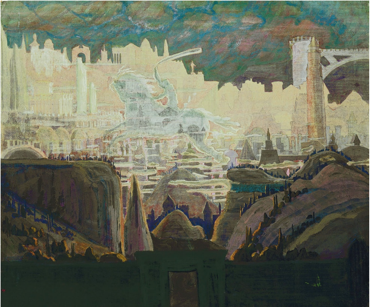
M. K. Čiurlionis. Miestas. Preliudas. 1908–1909 m. Saugoma Nacionaliniame M. K. Čiurlionio dailės muziejuje

vokiečių fašistai buvo jauni ir modernistai, kinų chunveibinai buvo jauni ir modernistai. Ir griovė, naikino, žudė visa, kas „sena“. „Sugriausime senąjį pasaulį“, ar kaip ten jų himnas, ir „pastatysim naują, jauną.“