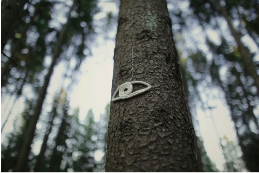
MEDŽIO AKIS.