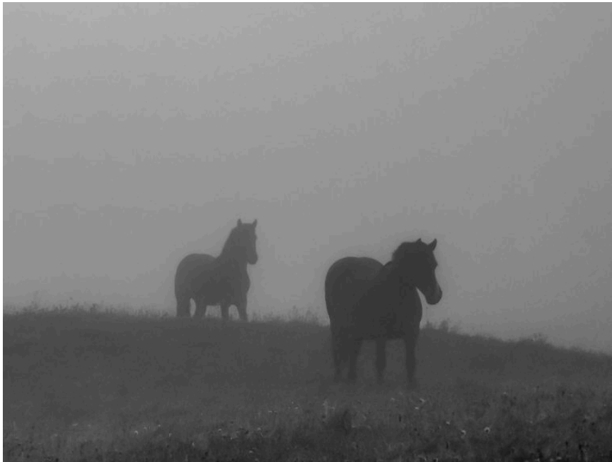
KŪNAS IR SIELA.

Tik tai supratus iš tikrųjų gali bent kiek paaiškėti santykis tarp „šiapus“ ir „anapus“. Visų pirma, tai tėra sielos mąstymo įrankiai – metaforos, paremtos talpos įvaizdžiu. Tarkim, įeiname į kambarį – tada labai aišku, kas yra „šiapus“ kambario sienų, kambario viduje, o kas „anapus“, išorėje. Kas nors gal mindžiukuoja ant slenksčio – tas bus tarpininkas tarp šiapus ir anapus, gebantis lengvai peržengti ribą į abi puses.