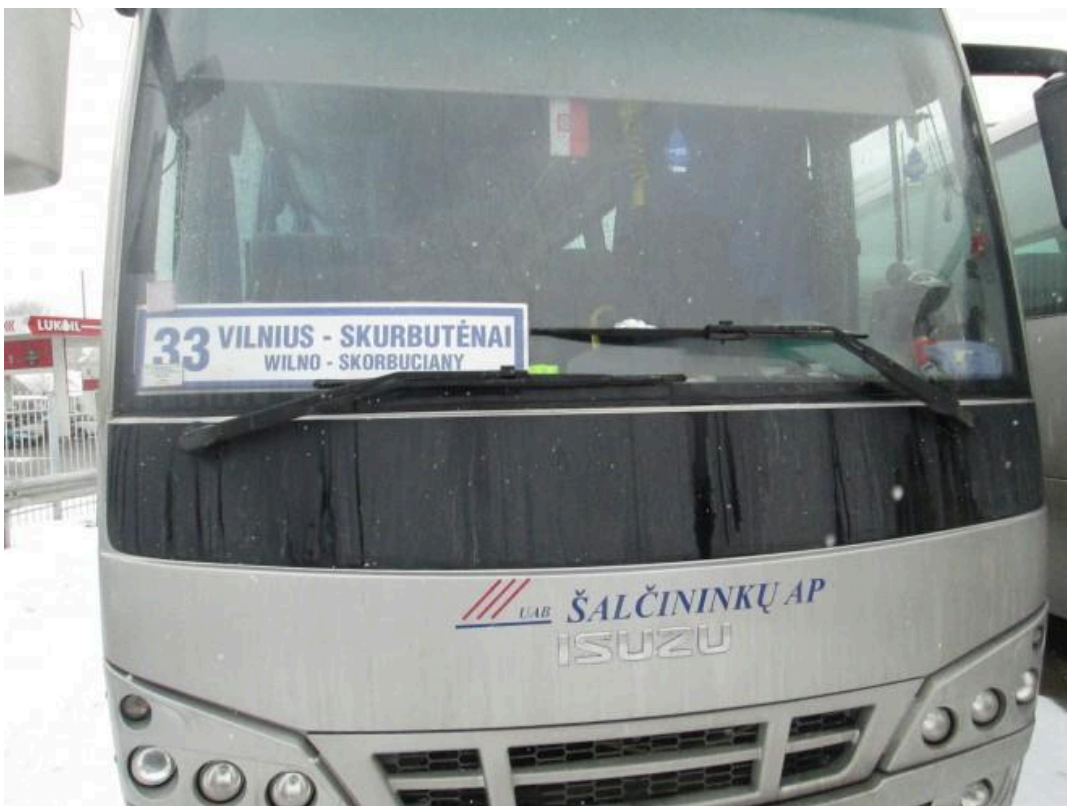
Autobuso maršrutas "Wilno-Skorbutiany"

Išdavikas būtinai niekina tai, ką išdavė (šitaip jis bando papildomai sau pateisinti išdavystę). Ir nekenčia. Todėl tampa piktesniu priešų už išorės priešą. Lietuvos nuo seno nekenčia ir Lietuvai kaip galėdami kenkia dviejų rūšių išdavikai: iš vienos pusės – seniau ir per lenkų okupaciją sulenkėję, susivilioję „būti lenkais“ ir iš aukšto lenkus vaidinantys; iš kitos – seniau ir per sovietinę rusų okupaciją su(balta)rusinti. Pastaruosius veikiau tiktų vadinti ne išdavikais, o aukomis, todėl dažnas iš jų nepraleidžia progos sulenkėti, jei tik tokia pasitaiko (kaip dabar pietryčių Lietuvoje).