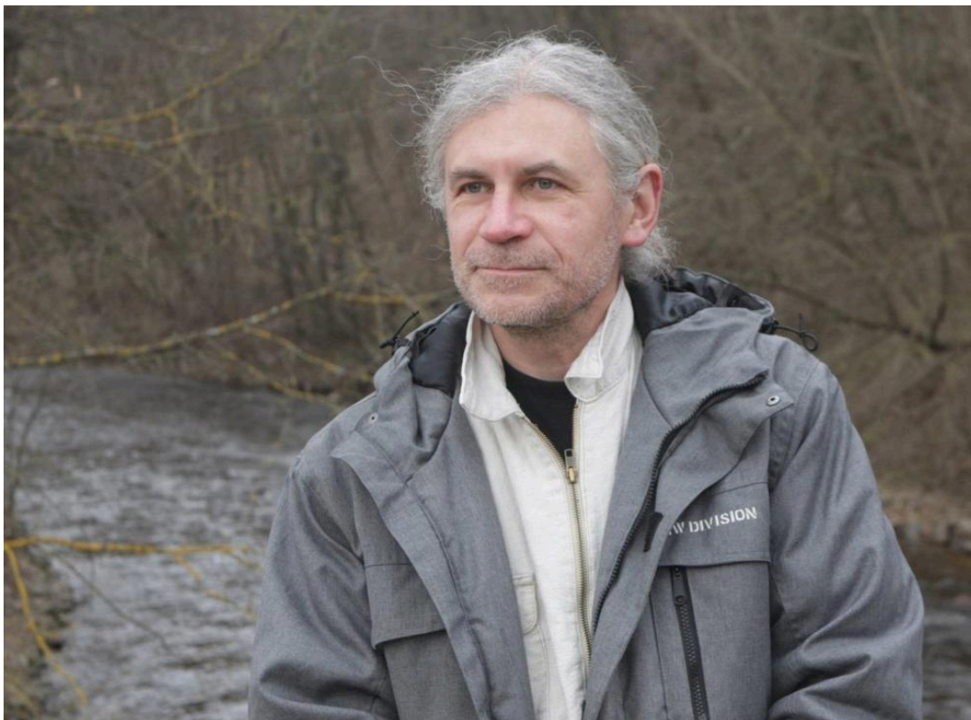
Dainius Razauskas | Redakcijos archyvo nuotr.

Iš tikrųjų mes perkame savimonę, savo nuomonę apie save, kurią susidarome pagal kitų nuomones. Perkame save kitų akyse, vienas kito akyse. Dėl to svarbu ne absoliuti, o santykinė kaina. Absoliuti kaina tėra „idealas“. Kaina pagal apibrėžimą yra santykinė.