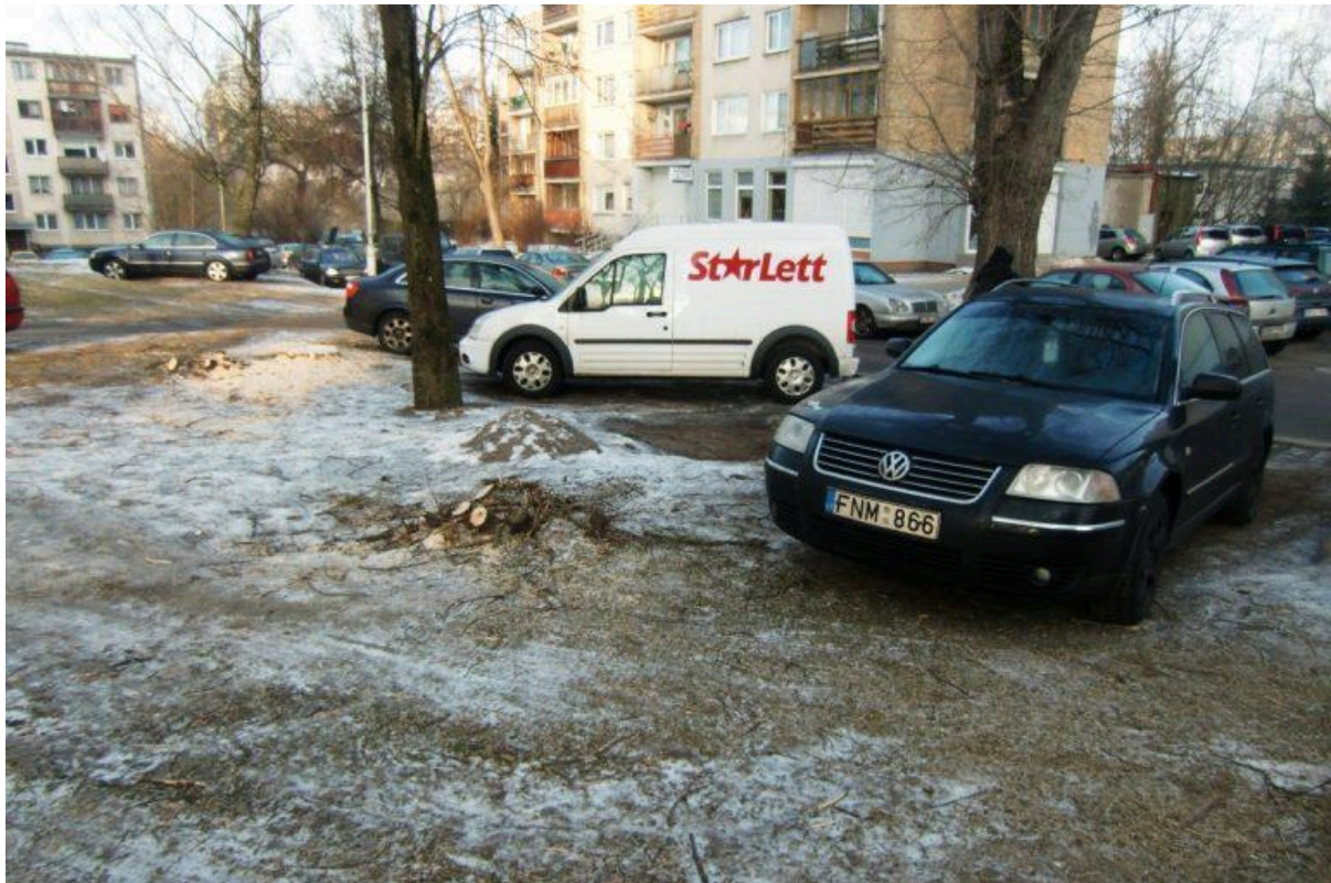
Nupjauti medžiai Antakalnio gatvėje Vilniuje

padėtį, regis, patyliukais palaiko. Juk ji pati ją ir sukūrė!