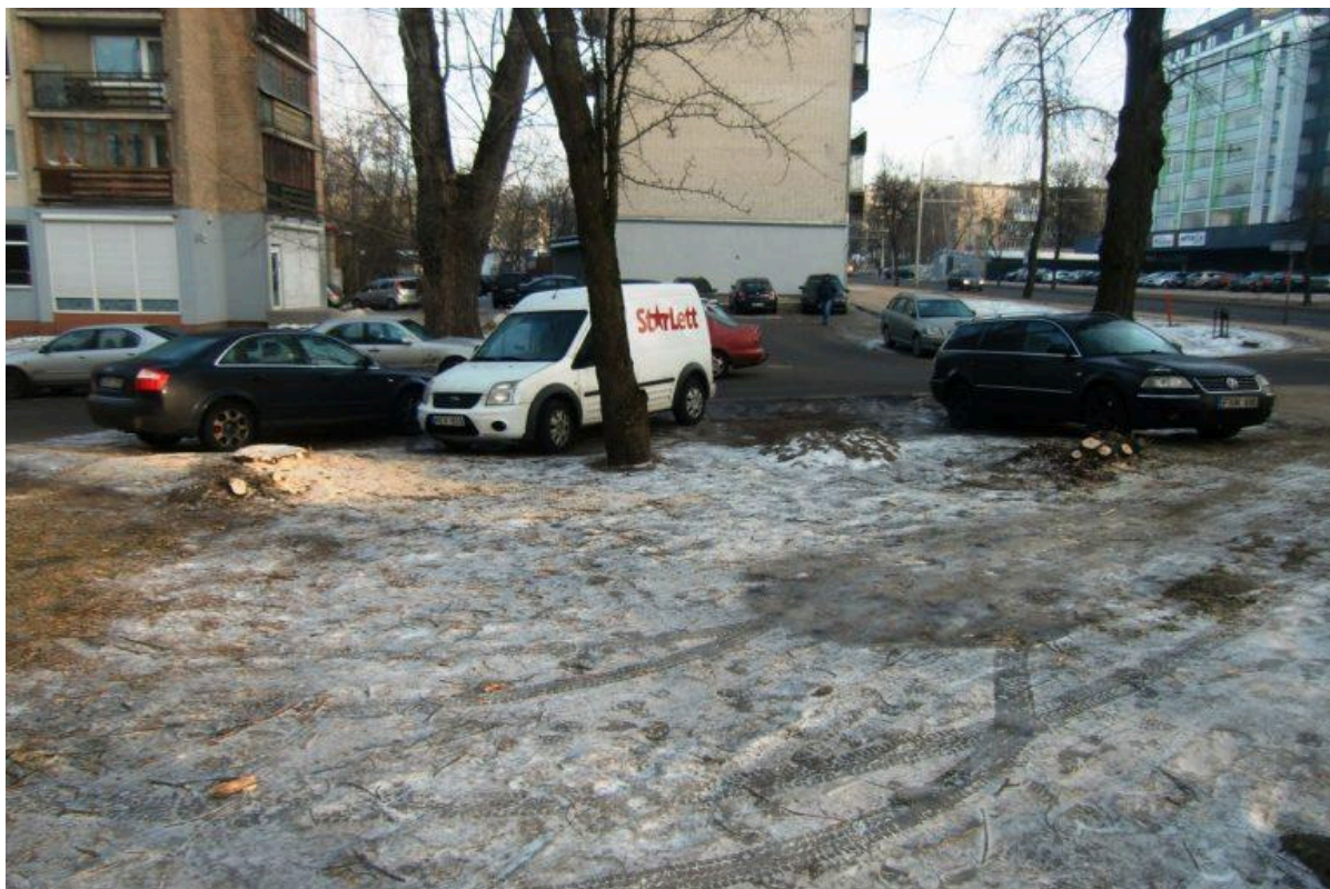
Nupjauti medžiai Antakalnio gatvėje Vilniuje

Tačiau viskas daroma priešingai: per gatvę nuo tos vietos, kuri matyti nuotraukose, ligi pat pernai metų nuo seno buvo mokama automobilių stovėjimo aikštelė, visuomet trečdaliu tuščia, nes automobilius NETEISĖTAI GALIMA nemokamai statyti ant vejų ir Savivaldybės nupjautų medžių kelmų. Todėl pernai aikštelės vietoje išdygo dar vienas gyvenamasis daugiaaukštis (matyti 3 nuotr. dešinėje).