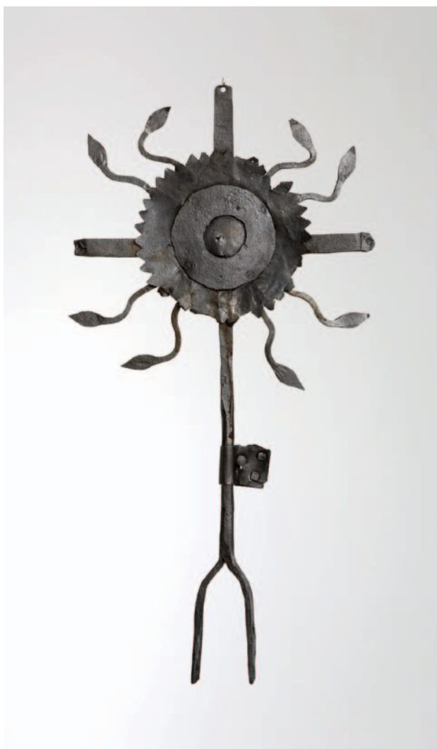
Paminklo viršūnė. Rokiškio r., Kamajų apyl., Krylių k. Geležis, 70,7 x 35,7cm Saugoma Lietuvos nacionaliniame muziejuje.

išplėtotas suomių ir karelių mitologijoje (žr. „Kalevalą“ 49, 335–341). „Kalevaloje“ apie dangaus šviesulių pradanginimą kalbama tokia kontekste: Saulę ir Mėnulį pagrobia Louhė, Pohjolos, tai yra tamsos ir šalčio šalies, mirusiųjų buveinės, esančios pasaulio pakraštyje 72 , šeiminkė. Pastvėrusi nuo beržo Mėnulį ir nuo pušies viršūnės Saulę, ji atsigabena juos į Pohjolą ir paslepia aukštame akmeniniame kalne. Žemę apgaubia visiška tamsa. Išminčius Veinemeinas, sužinojęs, kad dangaus šviesuliai yra Pohjolos kalne, vyksta jų vaduoti. Negalėdamas patekti į kalno vidų jis grįžta namo įrankių, kurie padėtų atidaryti kalną. Kalviui Ilmarinui tokius įrankius bekalant, Louhė, nujausdama grėsmę, pati išleidžia iš kalno Saulę ir Mėnulį, ir šie tuojau pakyla į dangų („Kalevala“ 49, 355–362):