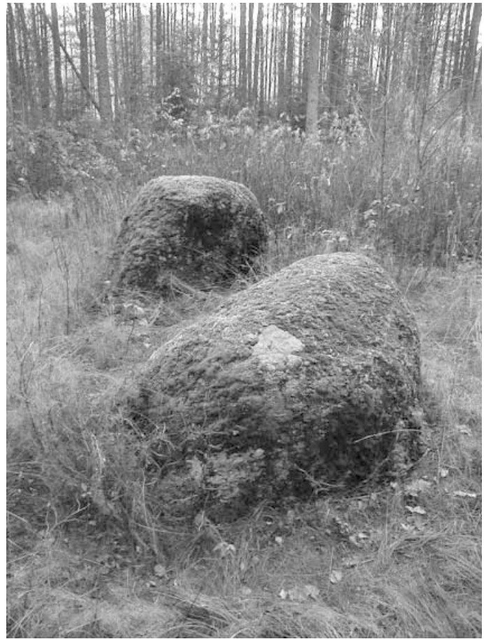
Akmenys „jaučiai“ prie Valų (Валы „Jaučiai“) k. Berezinsko r.

Paprastai šventųjų ežerų vanduo laikomas gydomuoju, juose draudžiama gaudyti žuvis. Ypač paprastų žmo-