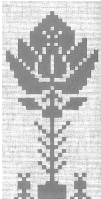
Stilizuotas Pasaulio medžio – jovaro atvaizdas, paimtas iš baltarusių liaudies siuvinėjimų.

Iš visko, kas pasakyta, galima padaryti išvadą, kad ežerų garbinimas susijęs su vandens ir vaisingumo kultu. Vanduo liaudies pažiūrose yra vienas iš pagrindinių kosminių elementų (kartu su žeme, oru ir ugnimi). Baltarusių mitologijoje, kaip ir daugelyje kitų, vanduo siejamas su pa-