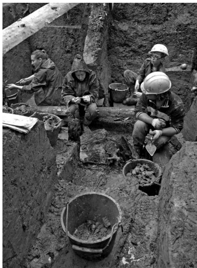
Kasinėjimų vaizdai. 2010 m.