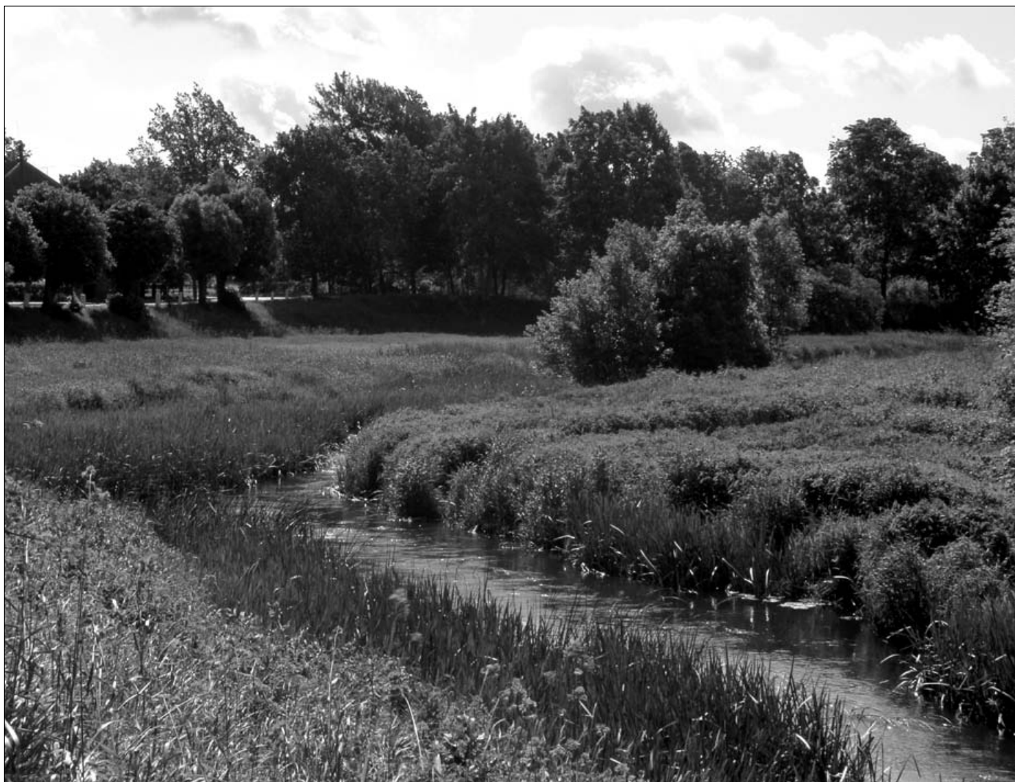
Varduvos kilpa Sedoje (Mažeikių r.), su kuria siejamas vaidilučių žūtis ir žemaičių krikšto motyvas. 2010 m.

Žemaičiai susijaudinę, kad jų dievybės ir šventenybės sunaikintos ir kad pats karalius juos įtikinėja, galop sutiko priimti krikščionių tikėjimą, nusikratyti pagoniškų nuodėmių ir pasikrikštyti vandeniu (...). Taigi žymesnieji