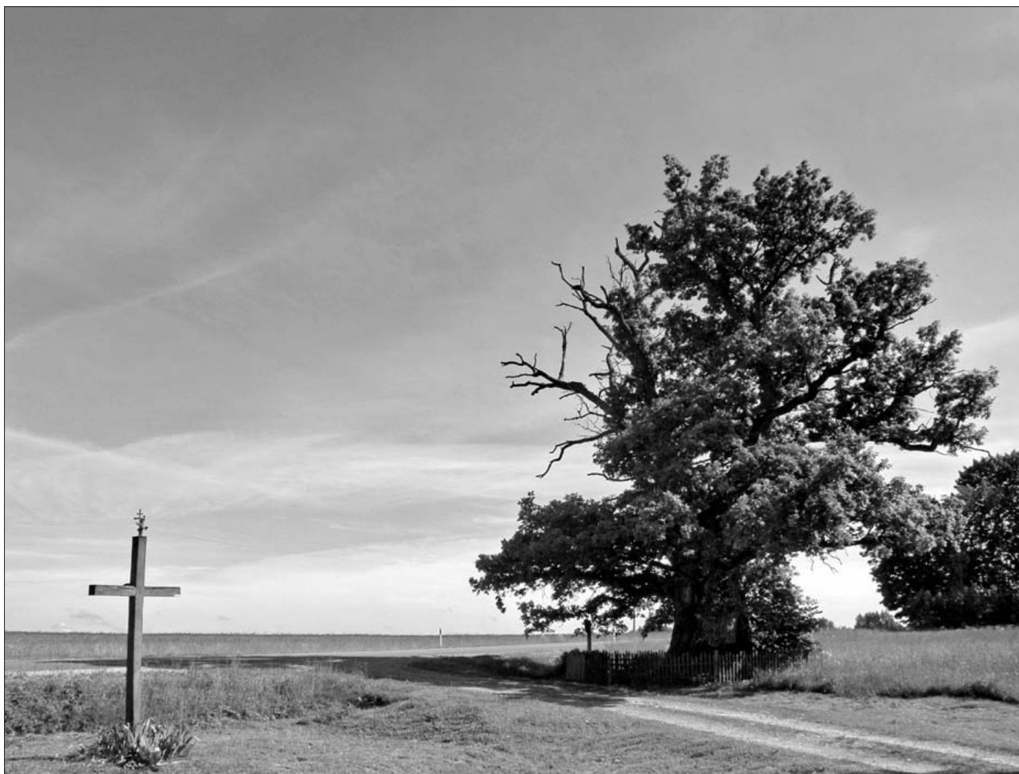
Vieštvėnuose (Plungės r.) augantis Mingėlos ąžuolas. 2009 m.

laikais iš kaimų buvo varomi žmonės ir krikštijami upės vandeniui. 36