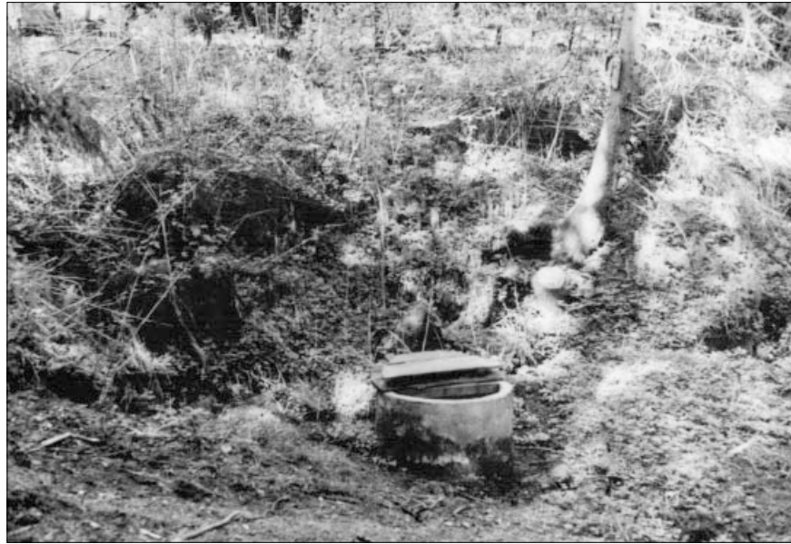
↑ 3 pav. Palazduonio (Kauno r.) šventas šaltinis. 1997 m.

Pagrįsta manyti, kad Pakalniškių Perkūnkalnio pavadinimu užfiksuotas čia garbinto dievo Perkūno vardas. Mergomis lietuvių tautosakoje dažnai vadinamos mitinės figūros, turinčios senųjų dievybių bruožų. Kaip minėta, tai ir vienas iš Raseinių krašte gerai žinomų deivių epitetų. Vis dėlto,