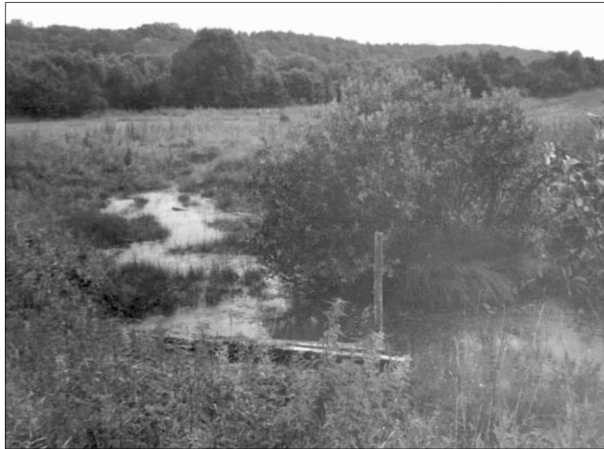
↓ 4 pav. Pašilių (Jurbarko r.) Alkaus upelis. 1996 m.