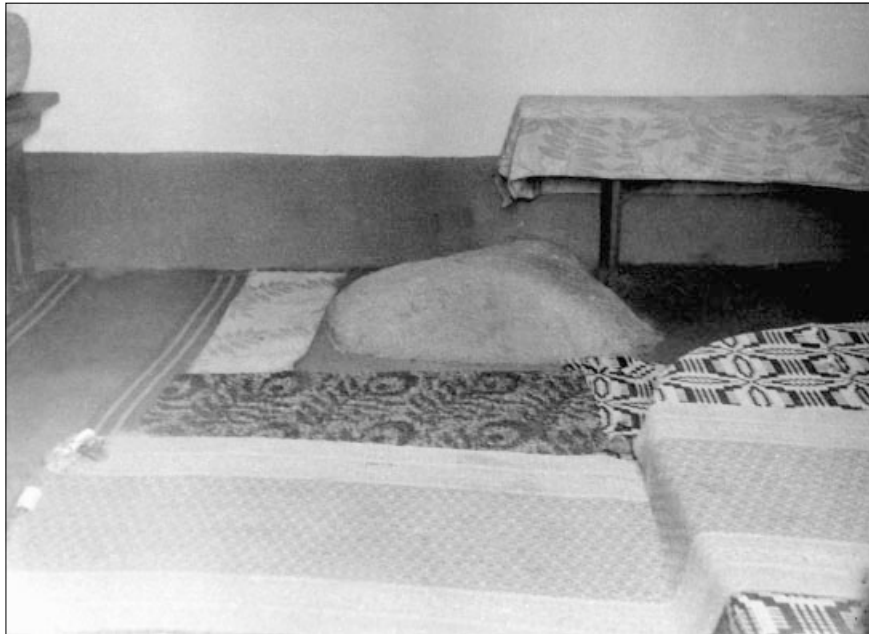
↑ 8 pav. Akmuo su pėdomis Maironių (Kelmės r.) kaimo koplyčios grindyse. 1994 m.

Reikia pridurti, kad pagrindiniai Žemaitijos christianizacijos darbai buvo nuveikti 1416–1417 m. (40; 45). 1413 m. Žemaitijos krikštas tebuvo epizodinė akcija. Jos metu Jogaila su Vytautu užtruko vos kelias dienas (41; 348), per kurias suspėjo „išgriauti aukurus”, „iškirsti šventąsias girias” prie Dubysos bei sunaikinti šventyklą prie Nevėžio.