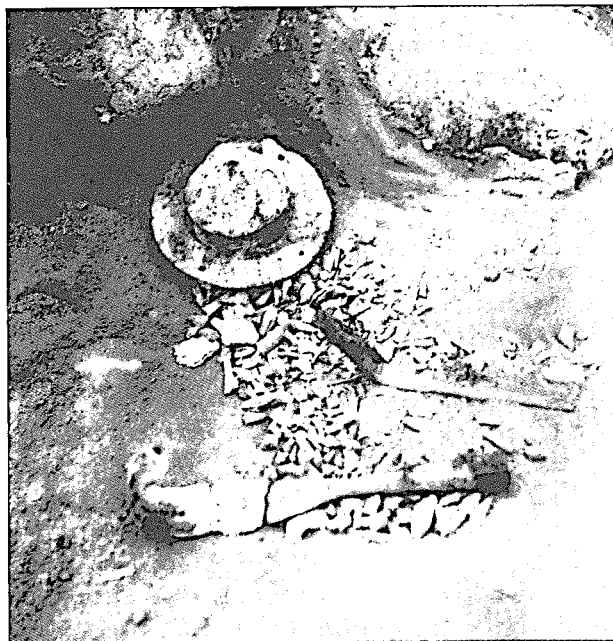
3 pav. Papiškių pilkapyne. Pilkapio 5 degintinio kapo 1 įkapės: kūgio formos skydo umbas, ietigalis ir peilis in situ . 1975 m. (LCVA ng. 1-35192). J. Markelevičiaus nuotr.

se randami išimtinai griautiniuose arba degintiniuose kapuose. Pavyzdžiui, konkrečiame pilkapyne umbų randa ma tik griautiniuose (plg. Baubonis–Mustenius, Degsnę) arba tik degintiniuose kapuose (plg. Popus–Vingelius, Vilkiautinį, Vyžius). Tą patį galima pasakyti apie likusius komplekto elementus. Tad duomenys, kuriais šiandien disponuoja lietuvių archeologija, rodytų, kad perėjimas prie mirusiųjų deginimo papročio iš esmės truko tiek, kiek ilgai buvo naudojami daiktai iš minėto vyrų daiktų komplekto. Tiksliau sakant, kai šie daiktai nebebuvo naudojami, jų nebeliko ir tarp įkapių. O tuo metu kremavimo paprotys Rytų Lietuvoje, matyt, jau buvo visuotinio pobūdžio. Vadinasi, mirusiųjų deginimo paprotys Rytų Lietuvoje galė-