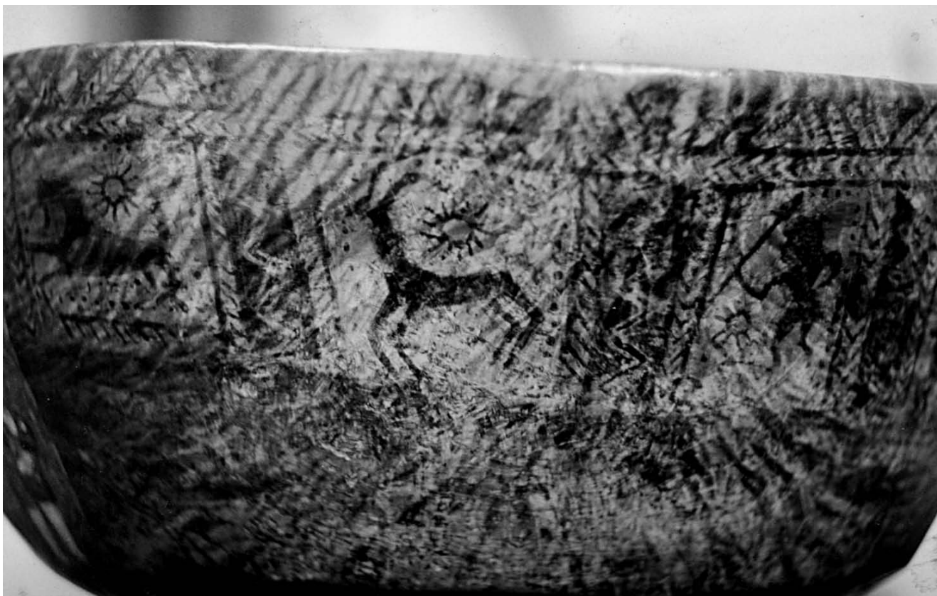
4 pav. Apeiginis kaušas iš Gardino su Zodiako ženklų atvaizdais. Apie XVI a. 2006 m.

tys, Saulei įžengus į eilinį Zodiako žvaigždyną, aukoti (deginti) atitinkamą Zodiako ženklą vaškinį atvaizdą (BRMŠ II: 465). Gal ožio aukojimo apeigų, kurios būdavo atliekamos prieš žiemos saulėgrįžą, atspindžių galima būtų įžvelgti ir kalėdiniame karnavale – pavyzdžiui, vaidybiniame „ožio numarinime“ ir jo „prisikėlimė“? Tačiau tai jau reikalautų atskiro tyrimo, o dabar grįžkime prie rudeninės „ožio ceremonijos“.