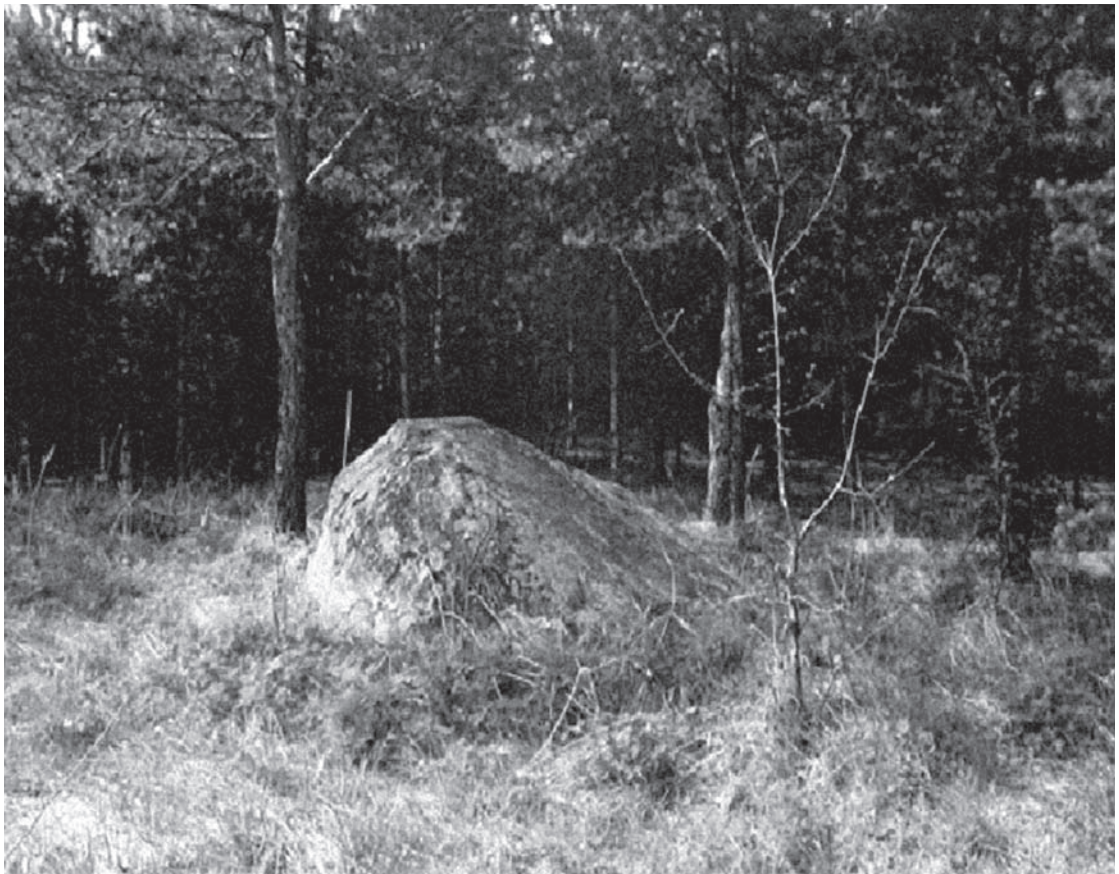
1 pav. Žmonės pasakoja, kad Šventakmenis kitados prarijo aviną, piemenį ir beržą. Kraujalių k., Molėtų r. 2011 m.

2001 m. šio straipsnio autoriui pavyko užfiksuoti vietos gyventojų pasakojimą apie Kraujalių k., Molėtų r., esantį sakralinį-mitologinį akmenį, vadinamą Šventakmeniu. Pasakojama, kad Šventakmenis kadaise prarijo aviną, piemenį ir beržą (1 pav.). Šiame pasa-