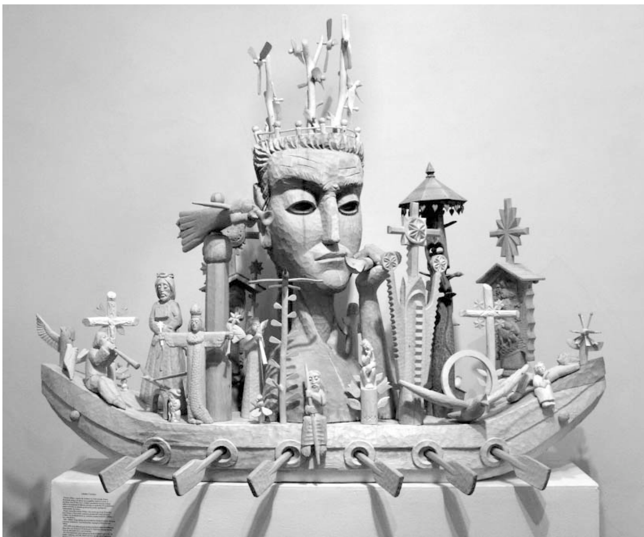
A. Teresiaus „Nojaus laivas“. 2001 m.

Šiuolaikinėje parodinėje liaudies skulptūroje labai išaugo veiksmo reikšmė. Meniškausi darbai kupini vidinės dinamikos. O skulptūrą supanti aplinka – meniškai sutvarkyta svarbių veikėjų reikimosi erdvė, primenanti scenovaizdį ar maketą. Teatro meno poveikis, stipriai pakeitęs profesionalios postmodernizmo dailės pobūdį, matyti ir tautodailėje, tik įgijęs kitą raiškos pavidalą. Statiškos skulptūros sugy-