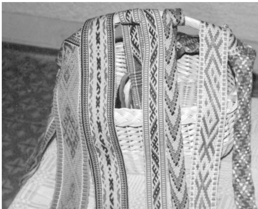
N. Akstinienės tradicinės ir stilizuotos juostos parodoje tautodailės galerijoje Alytuje. 2002 m. Vytauto Tumėno nuotrauka