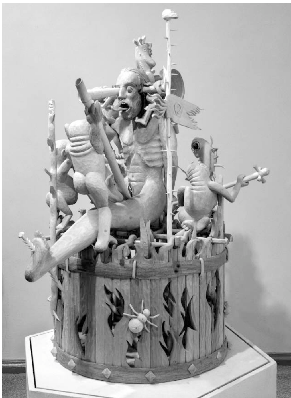
A. Teresius „Pragaras yra – ir aš jame buvau“. 2001 m.

Tautodailės šventės neteko buvusios visokeriopos centro globos, jos tapo kuklesnės ir vyksta dažniausiai regionuose, tad mažiau galimybių panaudoti anksčiau šalyje sukauptą patirtį. G. Puodžiukaitytės žodžiais, neliko retrospektyvinių parodų, kur greta buvo rodomas senasis ir dabartinis liaudies menas, mažiau jų rengiama užsienyje. Vyksta kraštų, rajonų, seniūnijų, grupinės, asmeninės ar kitokios parodos, apie kurias centre jau net nežinome. 31 Susiklosčius tokiais aplinkybėms sostinėje mažai bevyksta aukščiausio lygio tautodailės renginių, todėl sunku suvokti dabarties tautodailės visumą, koordinuoti problemų sprendimą, matyti, kokiais keliais kultūros globalizacijos, modernizavimo laikais ji suka.