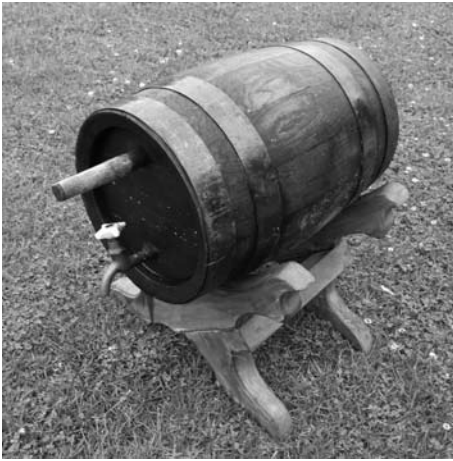
Alaus statinė su vole ir čiaupu (Biržų r., Kirkilų k.) Viktoro Dagio nuotrauka, 2011

iš medžio šaknies. Kubilo dugne įtaisomas filtras iš šiaudų grįžtės ir įvairiai sukryžiuojamų balanų. Kubilo dugno skylė užtaisoma iš juodalksnio išdrožta vole. Čia misa palaikoma apie keturias valandas. Paskui alus būdavo košiamas, t. y. išvalomas (alaus koštuvių paprotys atspindi šios procedūros svarbą). Per kubilo dugne įtaisytą filtrą misa košiama į kibirą. Iš kibiro skystis pilamas į statinaites per piltuvėlį – koštuvą, kurioje yra prikarpyta kūlio šiaudelių. Šitaip gaunamas gyvas, išvalytas gėrimas (Dulaitienė (Glemžaitė) 1958: 137–138).