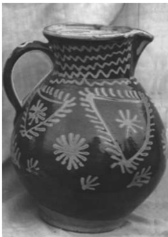
„Uzbonėlis alaus gėrimui“ (Kupiškio apyl., LTRFt 9) Balio Buračo nuotrauka, 1934

Nuleidžiant kraičius jaunikio pusėn, kraičvežiams įduoda gražiai drobės stuomenin suvyniotą didelį duonos kepalą ir statinaitę alaus. Tai daro, kad marti su rūgštim nutekėtų vyro šalin. Kaip kupiškėnuose sako, „marčios rūgštį veža“. Marčios rūgštį veža sudėtą į patalus, kuriais klos jaunųjų lovą vyro pusėje (Buračas 1935: 254).