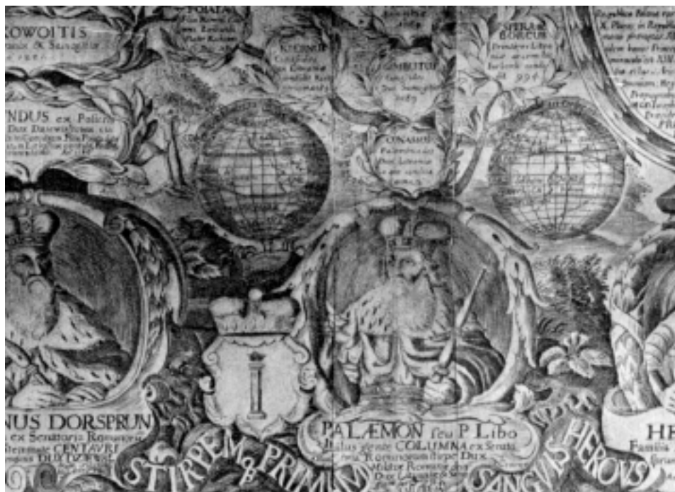
Palemonas arba Publijus Libonas. Radvilų genealoginio medžio fragmentas. XVII a. Krokuvos Czaratoryskių biblioteka

Vidinė padėtis Romoje buvo tokia, kad ne Bosporas