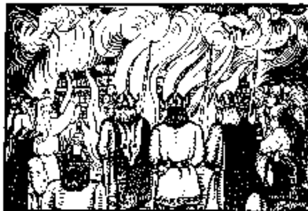
Adomo Galdiko iliustracija Vinco Krėvės knygai „Dainavos šalies senų žmonių padavimai“. 1921

auką: aukojama kiaulė, avis, jautis, nors lietuviškoje tradicijoje dažniau sutinkame vieno gyvulio (jaučio, ožio, kiaulės, šerno) aukojimą. Šiaip ar taip, žynys, net labiausiai įgudęs ar su pagalbininkais, šią auką turėjo atlikti ne greičiau kaip per ketvirtį valandos. Tikrai galimas dalykas, kad tuo metu vyksta priesaika (jeigu prisiekia ne rikiuotė, o teritoriniai būriai ar klanai atskirai, vienas po kito, tai irgi užimtų maždaug tą patį laiko tarpsnį). Išties būrimas po priesaikos būtų jau būrimas post factum , būrimas prieš priesaiką nebūtų rimtas, ir tai, kad Eiliiuotoji kronika praneša apie tam tikrą laiko tarpsnį, berods, simptomiška. Atrodo, kad