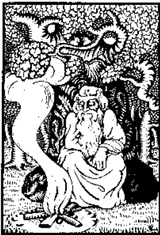
Adomo Galdiko iliustracija Vinco Krėvės knygai „Dainavos šalies senų žmonių padavimai“. 1921

Pasakymas „jie visi džiaugėsi“ ( sie waren allgemeine vro ), Wilhelmo Mannhardto nuomone, reiškia tai, kad tie visi buvo ir kuršiai, ir Ordino broliai, kažkuriuo būdu taip pat dalyvavę tame būrime ar bent jau jo paisę (LPG, p. 78). Šis dalykas pats savaime nedaug reikštų, bet jį vertinti tektų daug platesniame kontekste, visų pirma atsimenant, kad 1305 m. Rygos arkivyskupas apkaltino ordiną, jog jo broliai perėmė pagoniškus papročius. 1312 m. patikimi liudytojai praneša, jog broliai užsiima pranašystėmis ir ženklais ( divinationes et argumenta facere ), iš kiaulės mentikaulio buria vienas kitam ateitį, ir, atrodo, veiksmingai (pastaroji aplinkybė liudytų, kad tai toli gražu ne žaidimas, o ilgai praktikuotas ir būrimas) (LPG, p. 78–80). Nors tai smerktini dalykai, jie praktikuojami.