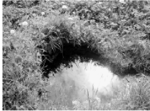
4 pav. Šaltinis Mildos slėnyje (kairiajame Varduvos upės krante)

„knyginės kilmės“ legendos tautosakos rinkėjų užrašytos kaip autentiškos. Šią prielaidą bent iš dalies patvirtina P. Vaičiūno, B. Sruogos, P. Abelkio kūryba bei XX a. pirmojoje pusėje aprašyta Mildos šventvietė Sedos apylinkėse.