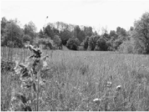
3 pav. Mildos slėnis. Mažeikių raj. Šalia Rimolių piliakalnio (kairiajame Varduvos upės krante)