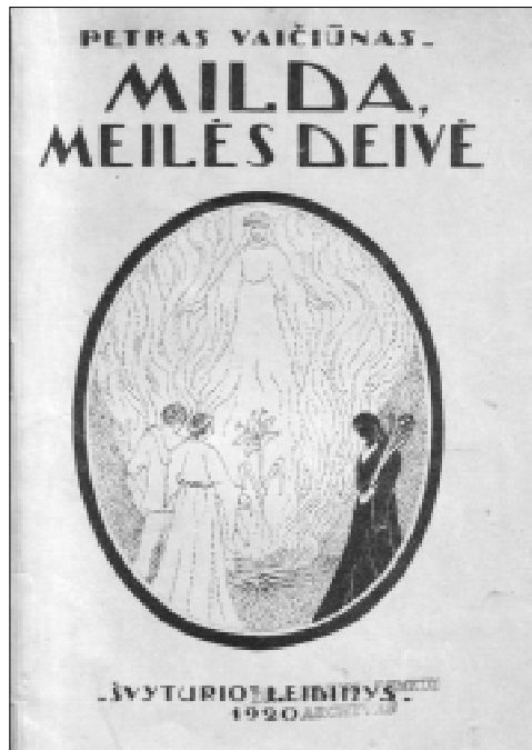
2 pav. Trijų dalių mitologinė pasaka scenai. 1920 m.